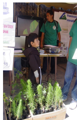
Franciscans International en la Expo-carisma Franciscano 2009.