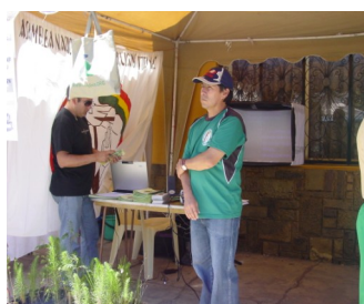
Miembros de la Célula ecológica Cochabamba

los efectos que esta produce en los más pobres que son los más afectados.