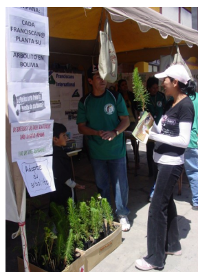
Campaña "Cada Franciscan@ planta su árbol en Bolivia".

Con motivo de celebrar los 800 años de la Orden Franciscana, el Centro Franciscano de Cochabamba